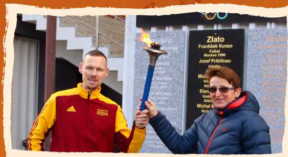
Matej Tóth a Elena Kaliská Slovenskí olympijskí víťazi