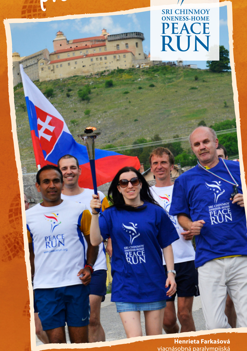
Henrieta Farkašová viacnásobná paralympijská medailistka