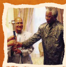
Nelson Mandela , nositeľ Nobelovej ceny mieru