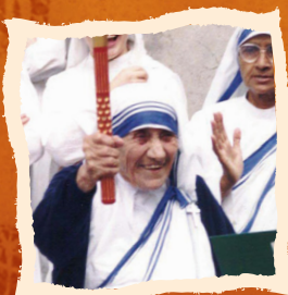
Matka Tereza , nositeľka Nobelovej ceny mieru

Každý z nás má v sebe plameň nádeje – túžbu po lepšom svete a šťastnejšej budúcnosti. S každým podaním pochodne mieru z ruky do ruky sa tento plameň šíri od srdca k srdcu po celom svete. Bežať s pochodňou alebo s ňou prejsť pár krokov a vložiť do nej svoje želania pre lepší svet môže každý. Mnoho významných osobností z celého sveta sa práve týmto spôsobom každý rok do štafety zapája.