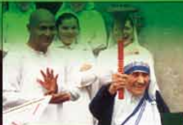
Mère Teresa et Sri Chinmoy