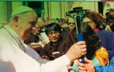
Le Pape François bénit le flambeau de la Paix à Rome