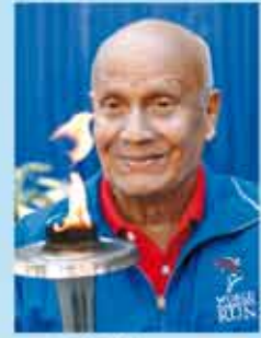
Sri Chinmoy Fondateur