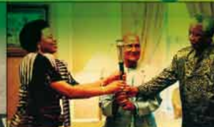
Nelson Mandela, ancien Président de l'Afrique du Sud , et son épouse Marna Graça Machel en compagnie de Sri Chinmoy.