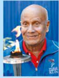
Sri Chinmoy Fondateur