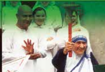
Mère Teresa et Sri Chinmoy