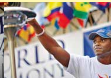
Carl Lewis , légende olympique, allume le flambeau au lancement de la Peace Run à New York