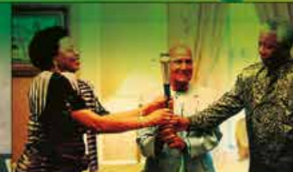
Nelson Mandela, ancien Président de l'Afrique du Sud , et son épouse Mamma Graça Machel en compagnie de Sri Chinmoy.