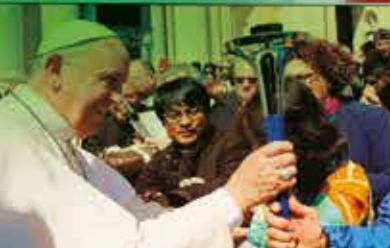
Le Pape François bénit le flambeau de la Paix à Rome