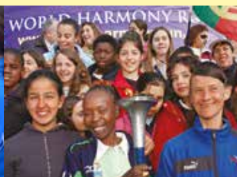
Tegla Loroupe , recordwoman de marathon, avec des enfants en Italie.