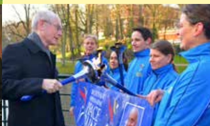
Herman van Rompuy , alors Président du Conseil Européen, allume les flambeaux européens.

Un Prix du Porte-Flambeau reconnaît les efforts individuels en rendant hommage aux pionniers bâtisseurs de paix de tous âges.