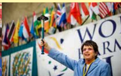
Billie Jean King , légendaire joueuse de tennis, participe au lancement de la Peace Run à New York.