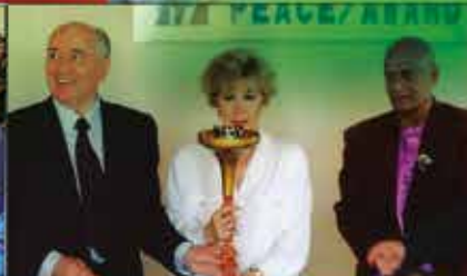
L'ancien Président soviétique Mikhail Gorbachev tient le flambeau avec son épouse Raisa Maximovna sous le regard de Sri Chinmoy.