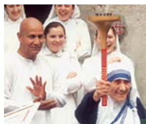
Mother Teresa and Sri Chinmoy celebrate the spirit of peace.