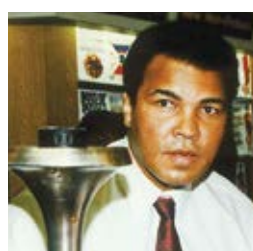
Muhammad Ali , world renowned boxing great, reflects on peace.