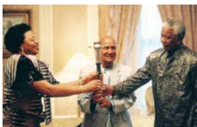
Nelson Mandela , former President of South Africa, and his wife Mama Graça Machel with Sri Chinmoy.