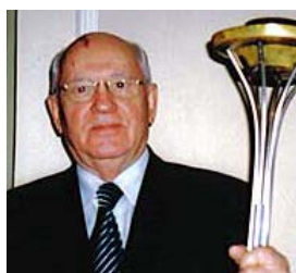
Former Soviet President Mikhail Gorbachev holds the torch.