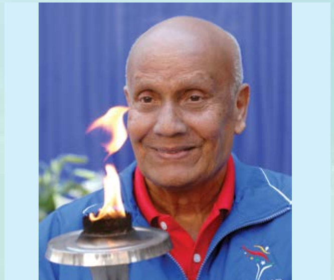
FOUNDER – Sri Chinmoy

세계 평화 달리기는 평화의 선구자 스리 친모이님께서 사랑, 화합, 하나됨의 정신으로 기초한 국제적인 행사입니다. 이 사랑, 화합, 하나됨의 정신은 평화 달리기 자체뿐만이 아니라 참여하는 모든 사람의 가슴 속에 퍼져 나갑니다. 운동선수, 철학자, 예술가, 음악가, 작곡가, 시인이기도 하셨던 스리 친모이님께서서는 이상적인 세상을 향해, 이세상이 우정과 하나됨으로 진보하는데 자신의 삶을 바치셨습니다.