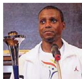
Nine-time Olympic gold medalist Carl Lewis speaks about the goals of the Run.