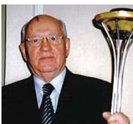
Former Soviet President Mikhail Gorbachev holds the torch.