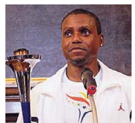
Nine-time Olympic gold medalist Carl Lewis speaks about the goals of the Run.