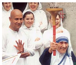
Mother Teresa and Sri Chinmoy celebrate the spirit of peace.