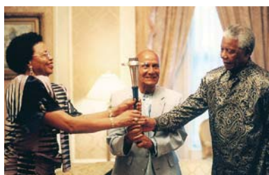
Nelson Mandela , former President of South Africa, and his wife Mama Graça Machel with Sri Chinmoy.