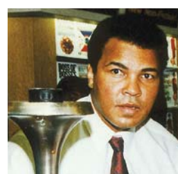
Muhammad Ali , world renowned boxing great, reflects on peace.