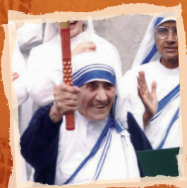
Matka Tereza, nositelka Nobelovy ceny míru

Běžet s pochodní či s ní ujít jen pár kroků a vložit do ní své přání pro lepší svět může každý. Mnoho významných osobností z celého světa se právě tímto způsobem každoročně do štafety zapojuje.