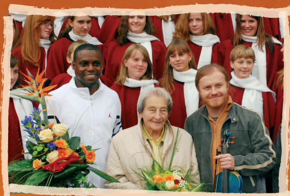
Devítinásobný olympijský vítěz a mluvčí běhu Carl Lewis, slavná oštěpařka Dana Zátopková, houslista Pavel Šporcl a dětský sbor Slavíci při slavnostním zakončení evropské části běhu v Praze (2008)