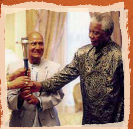
Nelson Mandela, nositel Nobelovy ceny míru