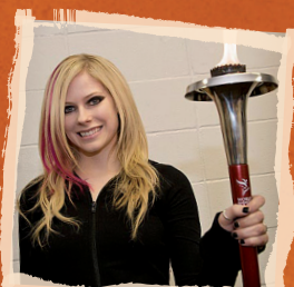
Avril Lavigne, kanadská zpěvačka