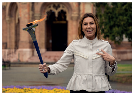
Miklósa Erika a Magyar Állami Operaház énekesnője, a békefutás magyarországi fővédnöke.