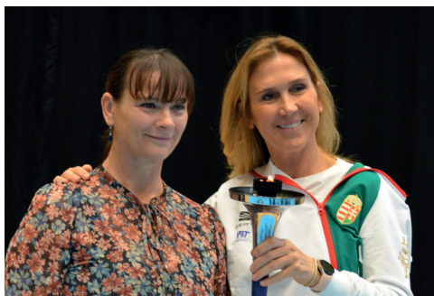
Kóbán Rita (kajak) és Nagy Tímea (párbajtőr) kétszeres olimpiai bajnokok.