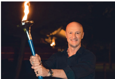
Marco Rossi a magyar labdarúgó válogatott szövetségi kapitánya.